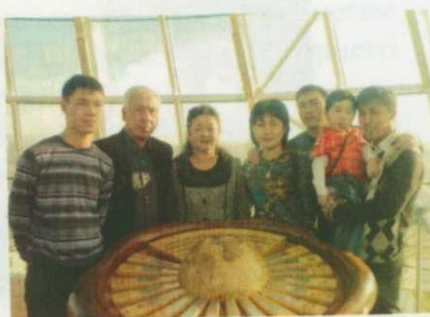
Құрмаштың отбасы. Астана. 2009 жыл.