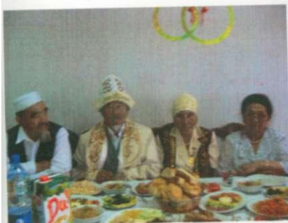
Әкей мен шешейдің Алтын тойы. 2007 жыл.