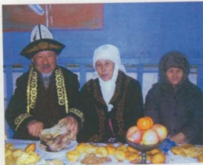
Наурыз тойында. Әкей, шешей және сіңілісі Тиыштық.