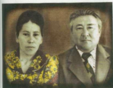
Әкей мен шешей. 1978 жыл.