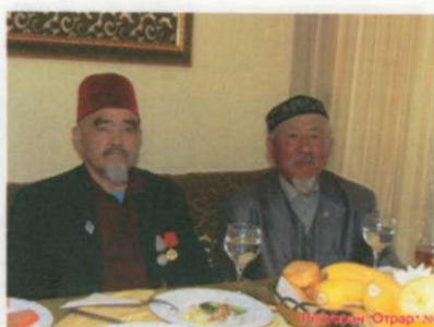
Әкей Шады құдамен. 2011 жыл.