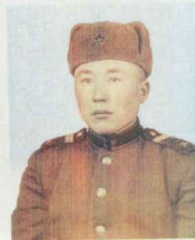
Әкейдің әскердегі өмірінен.