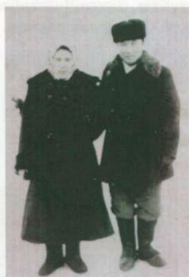
Әкей мен шешей. 1960 ж.